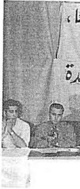
خلال المؤتمر الصحافي.